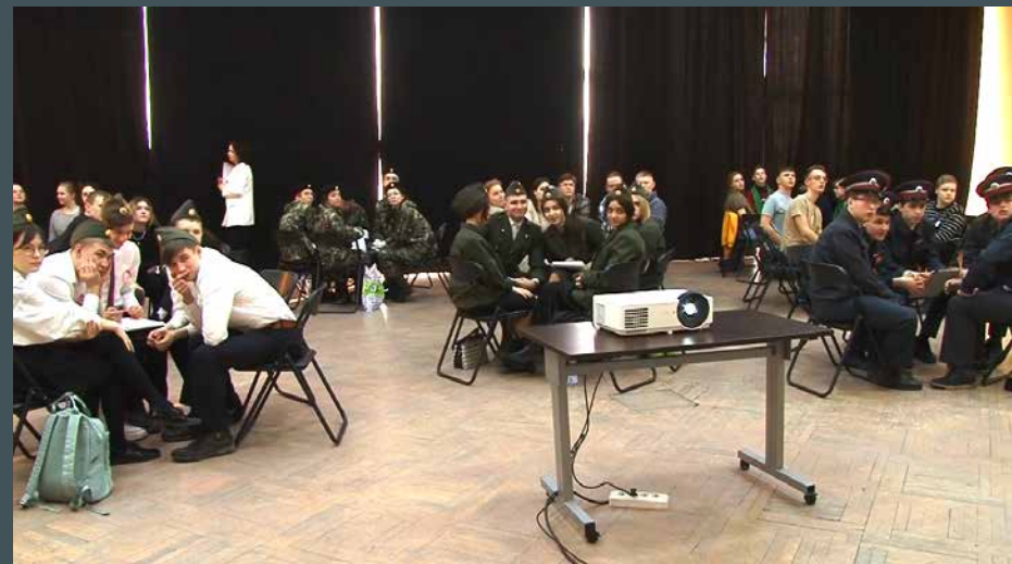
Схема внедрения интеллектуальных турниров в процесс тематических встреч и городских квиз-игр патриотической направленности определена и отработана на последующие периоды.